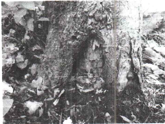
Foto 3. Vista de la base del tronco donde está el agujero con unos 10 cm de profundidad.